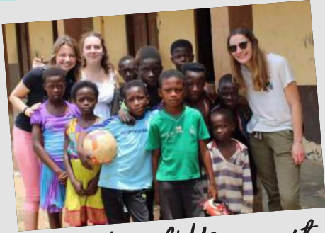
Bureau De l'Humanitaire

Le BDH, Bureau de l'Humanitaire de l'ENSIC, vient en aide aux étudiants de deuxième année s'investissant dans un projet de solidarité internationale . En effet, il leur apporte un soutien financier pour les aider à effectuer un voyage à l'étranger.